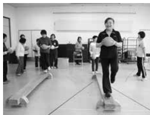
てんとうむし教室の様子

(てんとうむし教室は、地域包括支援センターから社会福祉協議会に委託し実施しています)