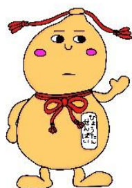
上富田町マスコットキャラクター 「ひょうたんせんぱい」