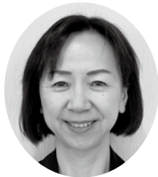
副議長 中井 照恵