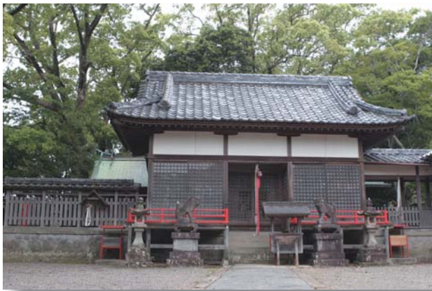
岩田神社の神像群

阿吽（あうん）の一対で材質は檜一木造り、両頭とも彫り深く、ことに頭部の彫刻がすぐれている。両脚のふんばりもよく体部に波形の彫りを入れ彩色を施したようである。室町時代から江戸時代（1600年代）のものと思われる。