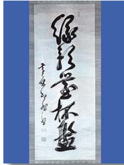
紙本即非如一一行書

縦138センチ、横49センチの軸装で、隠元が81歳のときの遺墨です。悟境に達した老僧の風格が感じられる作品です。