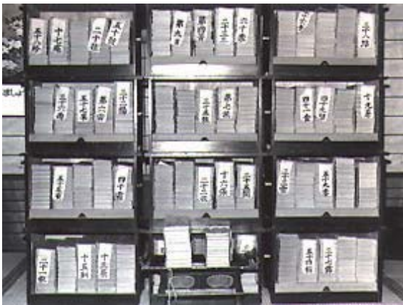
紙本墨書大般若経

江戸時代後期の作品で、三栖組大庄屋を天保2年（1831）辞して画業に専念した真砂幽泉の作で、最も彼の作風を代表し円熟した境地を示しています。